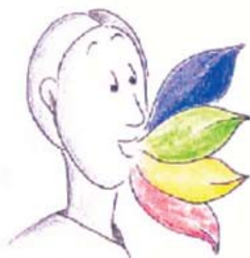
Sender mit vier Schnäbeln

Interkulturelle Begegnungen zwischen Menschen führen nicht automatisch dazu, dass Vorurteile abgebaut werden – im Gegenteil, oft werden bereits vorhandene Vorurteile durch den Kontakt mit Menschen einer „anderen Kultur“ verstärkt. Dies steht damit in Zusammenhang, dass Menschen beim Beobachten Anderer dazu neigen, spezifische Verhaltensweisen zu bemerken, die die bereits vorgefasste Meinung bestätigen. Die eigene Meinung wird somit nach dem Motto „Ich habs ja gewusst!“ für richtig erklärt. Ein vorurteilsfreies Klima kann jedoch aktiv durch Kooperation sowie durch einen ähnlichen Status der AkteurlInnen gefördert werden.