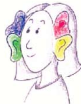
Empfänger mit vier Ohren